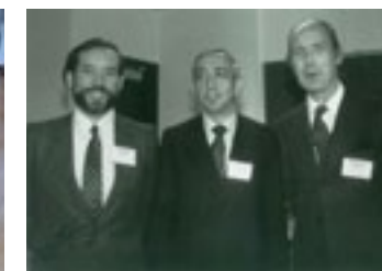
1980 Junta Directiva de ALDEUU (Spanish Professionals in América, Inc)