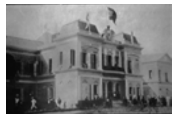
1912 Hospital de la Sociedad Española de Auxilio Mutuo y Beneficencia de Puerto Rico / Spanish Mutual Aid Society Hospital of Puerto Rico