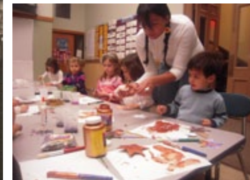
2010 Niños en el CENY (Centro Educativo Nueva York) / Children at CENY (Centro Educativo Nueva York)

Spaniards who immigrated to the US throughout the 20th century and during the first decade of the 21st century assimilated fully into American society but kept their culture and traditions. In Puerto Rico, by contrast, Spanish immigrants have had a high profile because of the island’s strong cultural ties with Spain. Spaniards arriving in the US directly from Spain or through other countries (mainly Cuba and Mexico,) during the 20th century settled mainly in New York as well as in Florida and California, later spreading across other states.