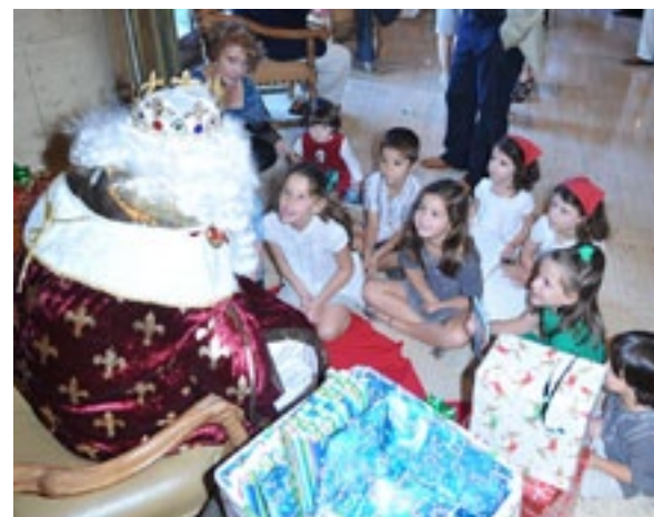
1950 Casa de Galicia de Unidad Gallega, Nueva York / House of Galicia, New York

James D. Fernández, “The discovery of Spain in New York, circa 1930”, Ed. Edmund J. Sullivan, (2010).