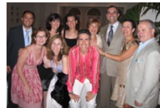
2007 Asociación Cultural Española en Boston / Boston Spanish Cultural Association