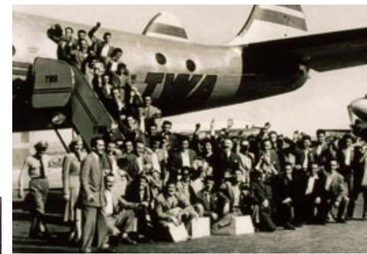
1951 Grupo de pastores vascos contratados por el gobierno norteamericano / A group of Basque shepherds hired by the US government.