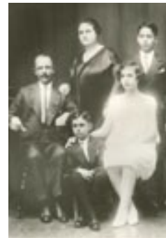
1964 Xavier Cugat