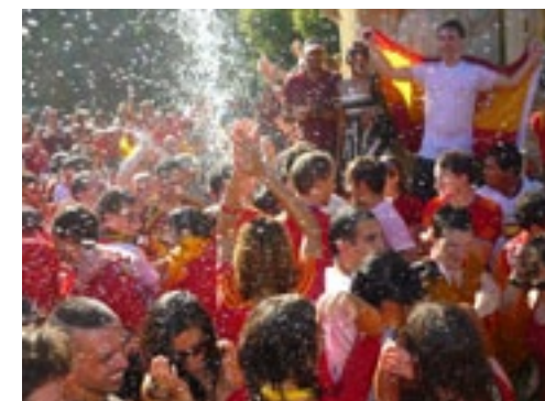
2010 Celebrando la Copa del Mundo en Washington DC / Celebrating the World Cup in Washington DC